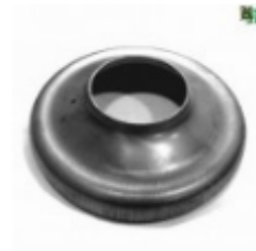
Переходник на трубу, арт. 8.15976