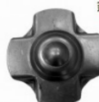
Декоративный колпачок, арт. 8.921 д=78x1,5мм Вес: 0.06 кг Цена: 30 руб.