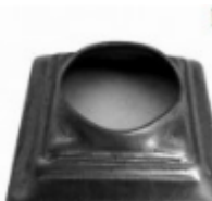
Переходник на трубу, арт. 8.808042 кв.80x80мм, переход на д=42x2мм Вес: 0.11 кг Цена: 59 руб.