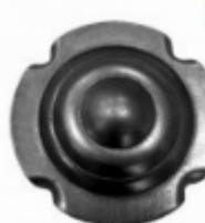
Декоративный колпачок, арт. 8.926 д=78x1,5мм Вес: 0.06 кг Цена: 25,50 руб.