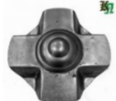
Декоративный колпачок, арт. 8.920 д=120x1,5мм Вес: 0.14 кг Цена: 60 руб.