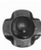
Декоративный колпачок, арт. 8.929 д=45x1,5мм Вес: 0.018 кг Цена: 16 руб.