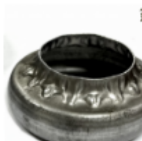
Переходник на трубу, арт. 8.878 д=76мм, переход на д=57мм Вес: 0.15 кг Цена (за шт): 123 руб.