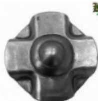
Декоративный колпачок, арт. 8.925 д=45x1,5мм Вес: 0.02 кг Цена: 17 руб.