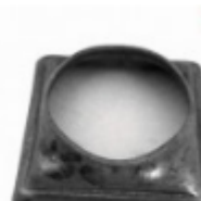
Переходник на трубу, арт. 8.606042 кв.60x60мм, переход на д=42x2мм Вес: 0.04 кг Цена: 44 руб.