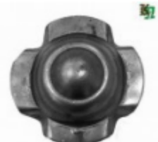
Декоративный колпачок, арт. 8.928 д=54x1,5мм Вес: 0.03 кг Цена: 20,50 руб.