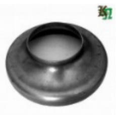
Переходник на трубу, арт. 8.15989