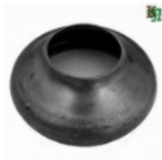
Переходник на трубу, арт. 8.10257