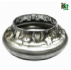
Переходник на трубу, арт. 8.883