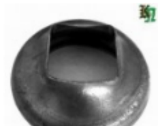
Переходник на трубу, арт. 8.764040 д=76мм, переход на кв.40x40 Вес: 0.23 кг Цена: 115 руб.