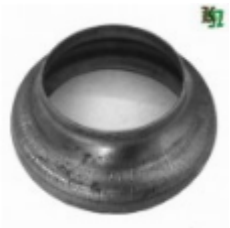
Переходник на трубу, арт. 8.10276