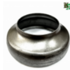
Переходник на трубу, арт. 8.10876