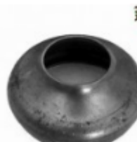
Переходник на трубу, арт. 8.7642 д=76мм, переход на д=42мм Вес: 0.23 кг Цена: 110 руб.