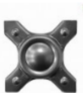
Декоративный колпачок, арт. 1911.36 65x65мм, д=35мм, под трубу 10x10мм Вес: 0.02 кг Цена: 19 руб.