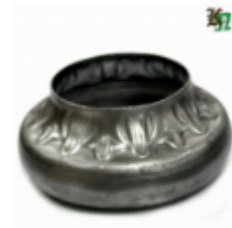
Переходник на трубу, арт. 8.877