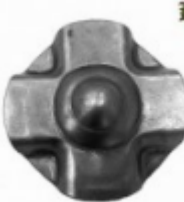
Декоративный колпачок, арт. 8.923 д=57x1,5мм Вес: 0.03 кг Цена: 18 руб.