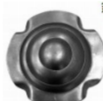
Декоративный колпачок, арт. 8.927 д=54x1,5мм Вес: 0.03 кг Цена: 20 руб.