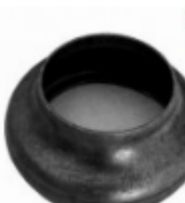
Переходник на трубу, арт. 8.7657 д=76мм, переход на д=57мм Вес: 0.23 кг Цена: 109 руб.