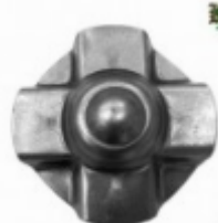
Декоративный колпачок, арт. 8.922 д=75x1,5мм Вес: 0.06 кг Цена: 20 руб.