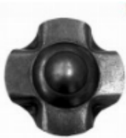
Декоративный колпачок, арт. 8.924 д=45x1,5мм Вес: 0.02 кг Цена: 21 руб.