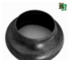
Переходник на трубу, арт. 8.5742 д=57мм переход на д=42мм Цена (за шт): 105 руб.