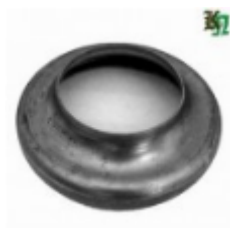
Переходник на трубу, арт. 8.159102